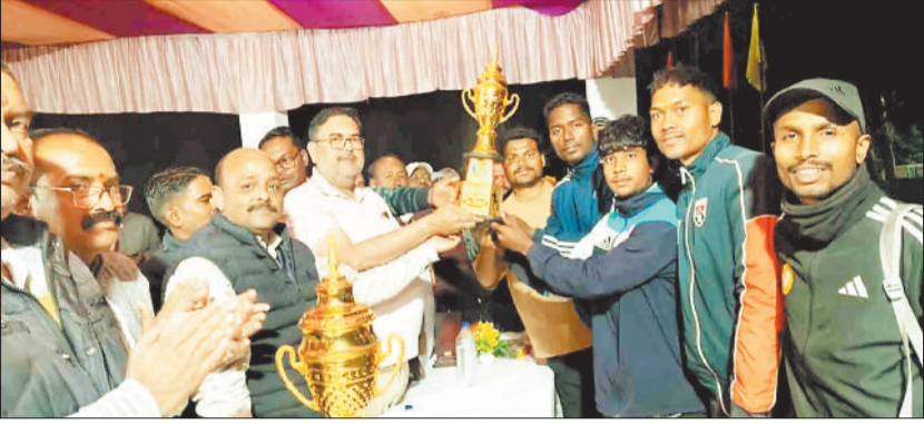
विजेता टीम को कप प्रदान करते अतिथि।