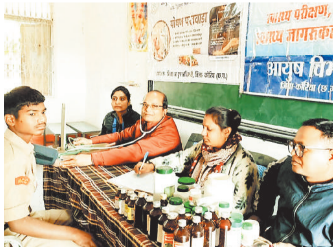
हरिभूमि न्यूज, बैकुण्ठपुर

कलेक्टर के निर्देश एवं जिला आयुष अधिकारी के मार्गदर्शन में 17 दिसंबर को शासकीय आदर्श रामानुज उच्चतर माध्यमिक विद्यालय बैकुण्ठपुर में एनसीसी कैडेट्स का स्वास्थ्य परीक्षण एवं चिकित्सा शिविर आयोजित किया गया। इस अवसर पर शीत ऋतु में होने वाले विभिन्न रोगों के लक्षण एवं उनसे बचाव के उपाय, गैर संचारी रोग (एनसीडी) के लक्षण व रोकथाम, स्वच्छता के महत्व, सुपोषण की उपयोगिता सहित स्वास्थ्य संबंधी महत्वपूर्ण जानकारी दी गई। चिकित्सा शिविर में विशेष रूप से एनसीसी प्रशिक्षण शिविर से पूर्व कैडेट्स आयुष विंग जिला चिकित्सालय का स्वास्थ्य परीक्षण किया गया तथा कैडेट्स एवं विद्यालयीन स्टाफ को आवश्यक औषधियां वितरित की गईं। कार्यक्रम के सफल आयोजन में