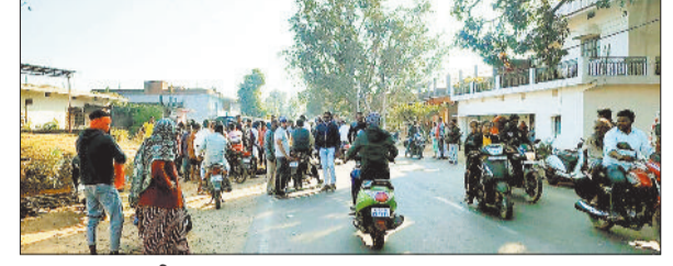
घटना स्थल पर भीड़।

साल का आखिरी महीना दिसंबर चल रहा है और दिसंबर के महीने में सड़क दुर्घटना की घटनाओं में बढ़ोतरी हो जाती है। सड़क दुर्घटनाओं के मुख्य कारणों में तेज रफतार वाहन चलाने के साथ शराब सेवन कर वाहन चलाने की वजह से सबसे अधिक दुर्घटना होती है।