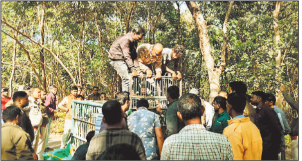
रेस्क्यू में शामिल वन अमला।