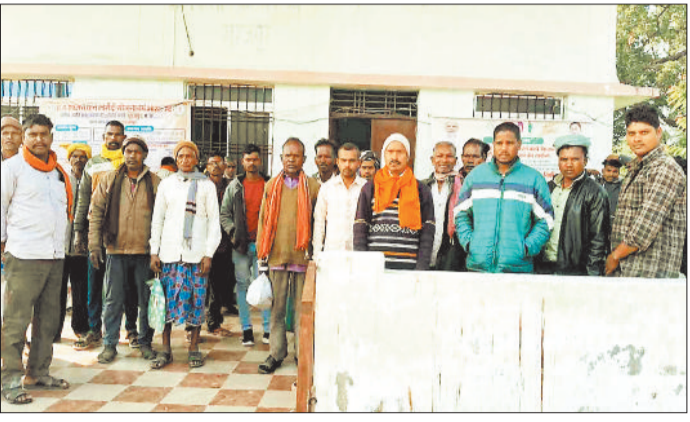
धान खरीदी केन्द्र में टोकन के इंतजार में किसान।