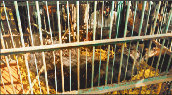
पिंजरे में कैद भालू।