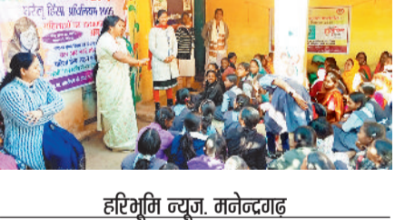
हरिभूमि न्यूज, मनेन्द्रगढ़

किसी भी सशक्त और समतामूलक समाज की नींव महिलाओं और बच्चों के अधिकारों की सुरक्षा से ही मजबूत होती है। इसी उद्देश्य को केन्द्र में रखते हुए महिला एवं बाल विकास विभाग द्वारा बेटी बचाओ बेटी पढ़ाओ योजना के अंतर्गत जयम लालपुर में बाल अधिकारों पर केन्द्रित एक व्यापक जागरूकता कार्यक्रम का आयोजन किया गया। यह आयोजन जिला कार्यक्रम अधिकारी के मार्गदर्शन में संपन्न