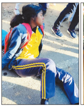
घायल छात्रा। दुर्घटनाग्रस्त बाइक व आँटो।

वर्ष के अंतिम दिनों में बढ़ जाते हैं हादसे